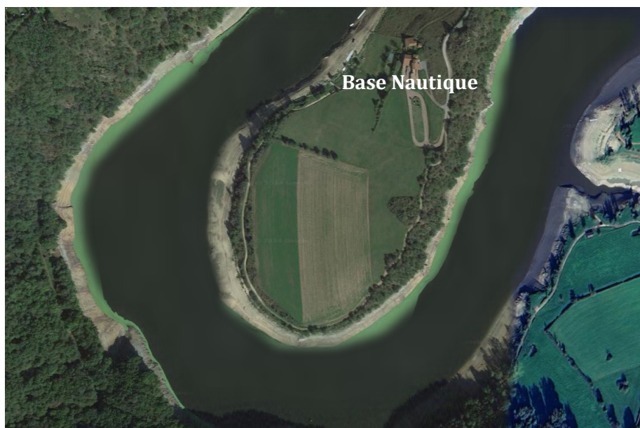
Schéma du parcours de compétition :